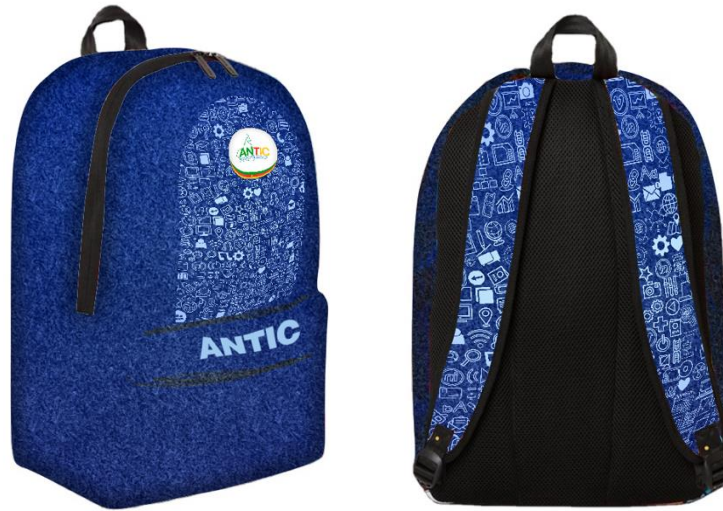
4. Sac à dos personnalisé

SUPPORT OEM&ODM, OFFER SAMPLE CHECK QUALITY